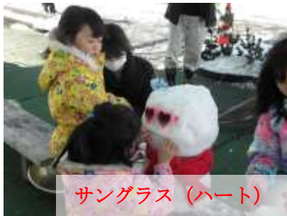
サングラス (ハート)