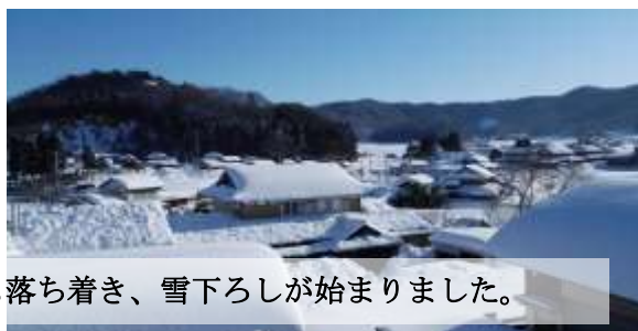
3月14日にはようやく雪も落ち着き、雪下ろしが始まりました。