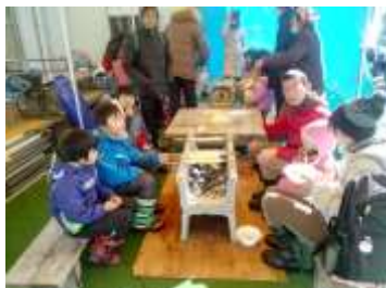
冬の体験 そり遊び