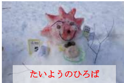
たいようのひろば