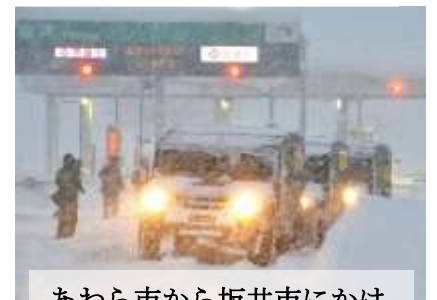
あわら市から坂井市にかけて国道除雪の為、自衛隊の出動がありました。