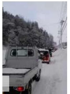
除雪が追い付かず一車線のみの道路となり、多くの場所で渋滞が発生しました。