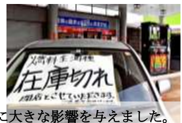
3月6日から8日にかけて8号線が通行止めとなり、ライフラインに大きな影響を与えました。